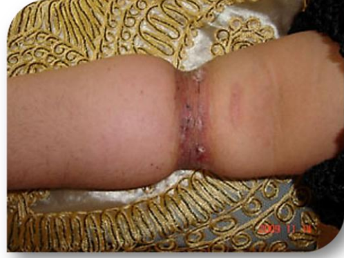
الشكل (٤ - ب)