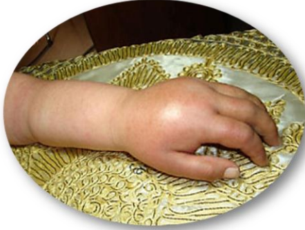
الشكل (١) مشاهدة ما قبل العمل الجراحي الطرف العلوي الأيسر Pre- Operative View Left Upper Limb

الوذمة شاملة لليد اليسرى وتمتد حتى منتصف الساعد. لاحظ الحدود العلوية الواضحة للوذمة، وبداية تشكل حلقة جلدية على شكل سوار.