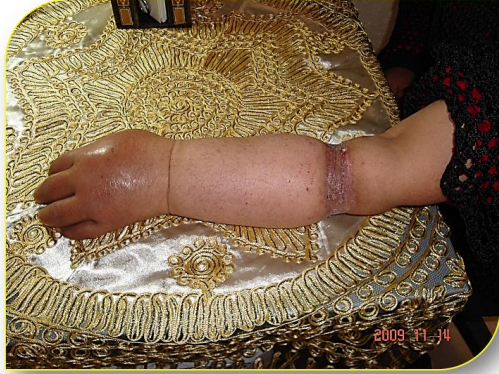
الشكل (٤ - ا)