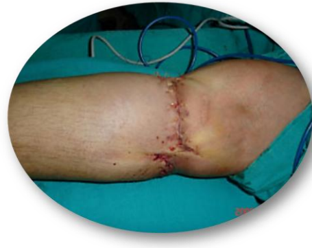
الشكل (٤ - ب)