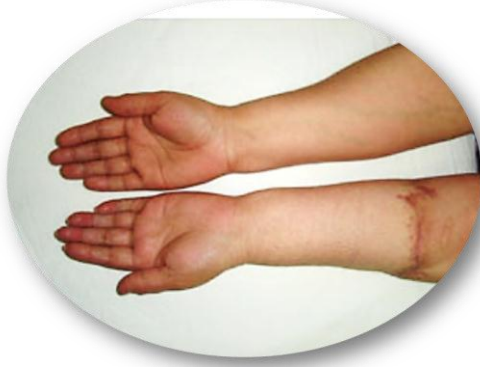
الشكل (ب - ٥)