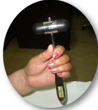
الشكل (أ - ٥)