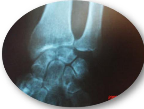
الشكل (٢) صورة شعاعية، قبل الجراحة المعصم الأيسر Pre- Operative X- Ray Left Wrist

الوذمة شاملة لليد اليسرى وتمتد حتى منتصف الساعد. لاحظ الحدود العلوية الواضحة للوذمة، وبداية تشكل حلقة جلدية على شكل سوار.